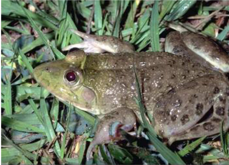
© Joseph MONDUKA, photo prise à Baoko (Cameroun oriental), dans le quartier Libamba sur la onzième avenue, vers le marais de Makele.