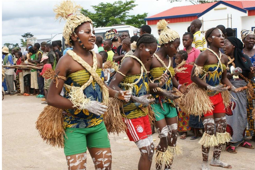
© Jean De Dieu MANGAMBU, photo prise dans la commune de Kisangani, au cours d’une soirée organisée après l’initiation Wagenia.

* Commentaire : Consulter la photographie.