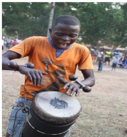
batteur de tam-tam, 16 janvier 2021; nsansi = voir poignets