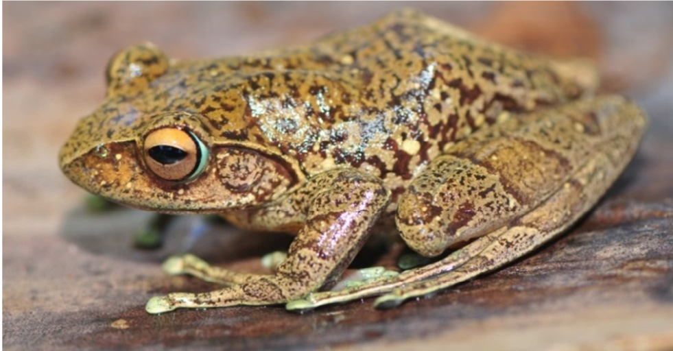
Photo de Boophis goudotii (Tshudi, 1838), grenouille consommée à Madagascar, photo prise à Mandraka